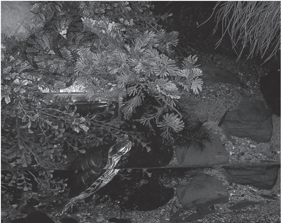
Fig. 9. Nerodia rhombifer samen met geelwangschildpad ( Trachemys scripta troosti ) in het aquaterrarium. (Foto Paul Storm).