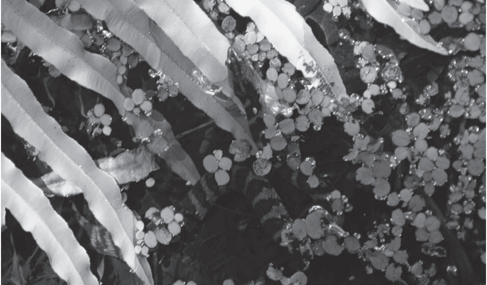
Fig. 3. Ondiep poeltje in Florida met jonge Nerodia fasciata pictiventris . Volwassen dieren (zie Fig. 2) werden aangetroffen kruipend over het land, jonge dieren met name in het water waarschijnlijk jagend op muskietenvisjes ( Gambusia ). (Foto Paul Storm).