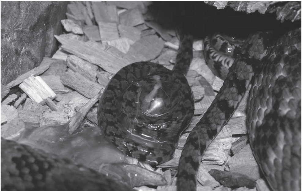
Fig. 12. Deze jonge Nerodia rhombifer heeft het moederlichaam net verlaten en zit nog in het eivlies. (Foto Paul Storm). Fig. 12. This young Nerodia rhombifer has just left the mother's body and is still in its egg membrane (Picture Paul Storm).