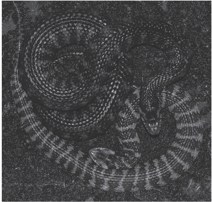
Fig. 1.: Couple of Florida (banded) water snakes ( Nerodia fasciata pictiventris ). The male (brighter snake bottom) shows more robust by broadening himself.