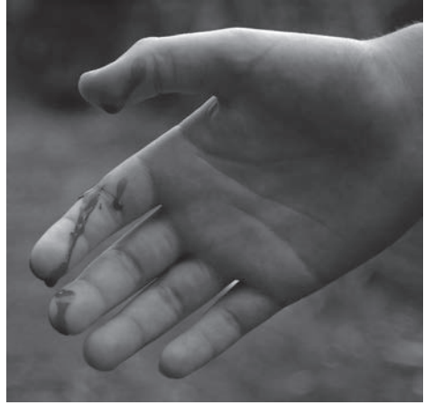
Fig. 10. Gevolgen van een beet van een kleinere Nerodia fasciata pictiventris in Florida.

In verband met het welzijn van de dieren en de voortplanting kan het verstandig zijn, afhankelijk van het oorsprongsgebied, de