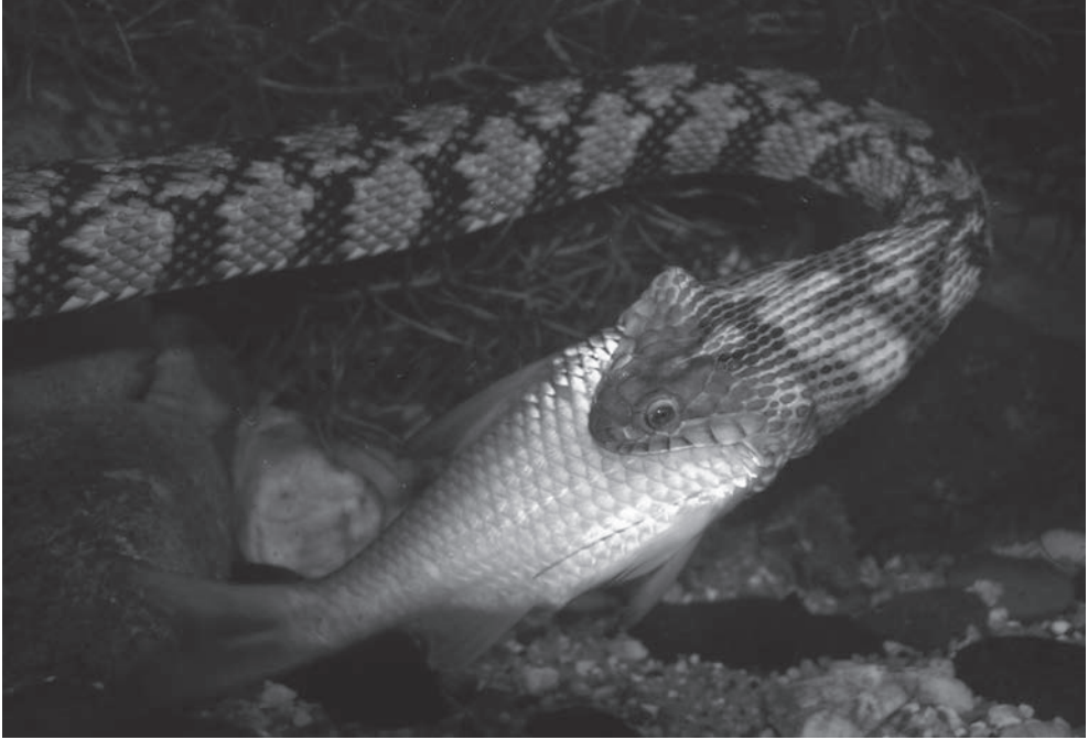
Fig. 11. Nerodia rhombifer in het aquaterrarium. - Fig. 11. Nerodia rhombifer in aqua-terrarium. (Picture Paul Storm).