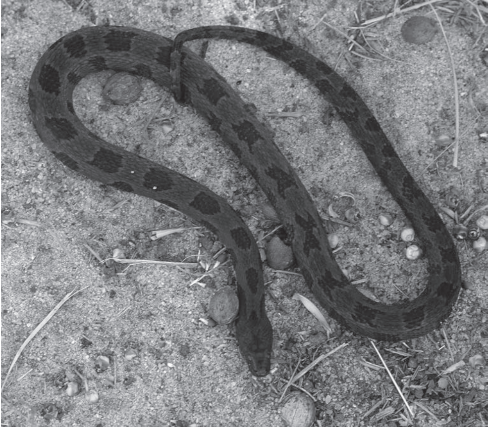
Fig. 5. Bruine waterslang (Nerodia taxispilota) man in Florida.