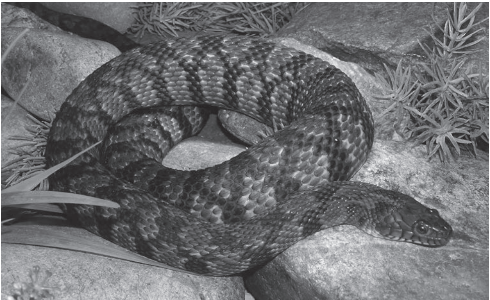
Fig. 4. Diamantrug waterslang ( Nerodia rhombifer ) vrouw in het aquaterrarium.