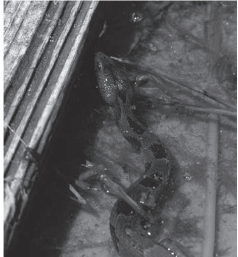
Fig. 6. Bruine waterslang (Nerodia taxispilota) man in Florida.