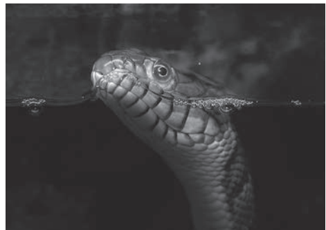
Fig. 8. Nerodia rhombifer in het aquaterrarium. Fig. 8. Nerodia rhombifer in aqua-terrarium.

more opportunistic and eats fish as well as amphibians (Gibbons & Dorcas, 2005). Adult water snakes are usually easily fed in practice. The fish eating Nerodia rhombifer (fig 11) accepted thawed frozen fish and cat food. It looks like these snakes prefer eating in water. You can put dry cat food in the water bowl which will be eaten by