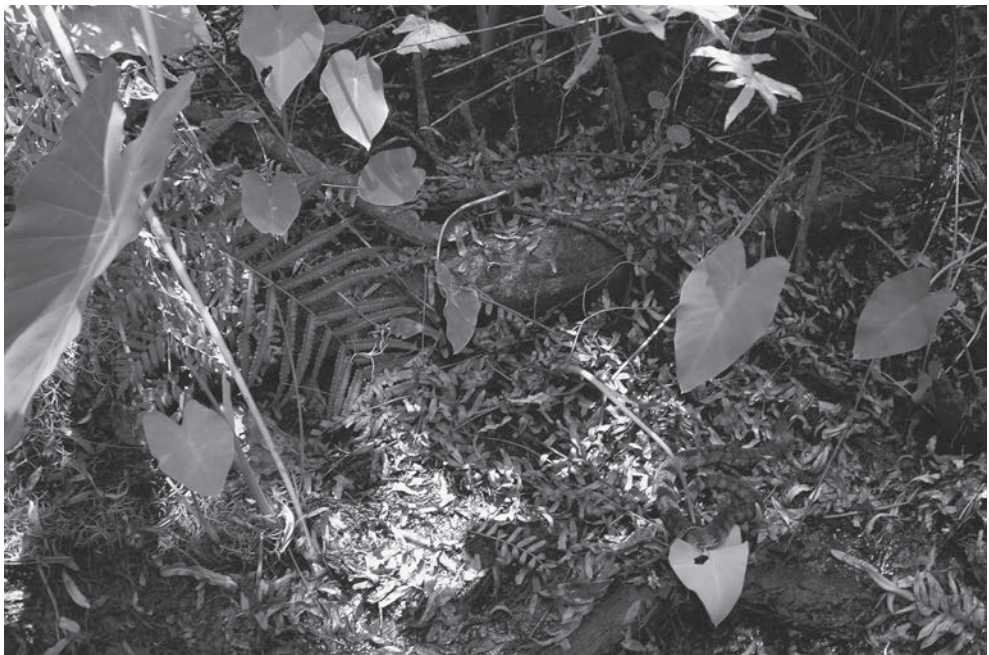
Fig. 2. Nerodia fasciata pictiventris in Florida, rechtsonder is deze slang te zien. (Foto Paul Storm). Fig. 2. Nerodia fasciata pictiventris in Florida, bottom right. (Picture Paul Storm).